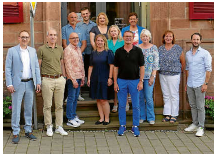
Neuer Gemeinderat der Gemeinde Loffenau