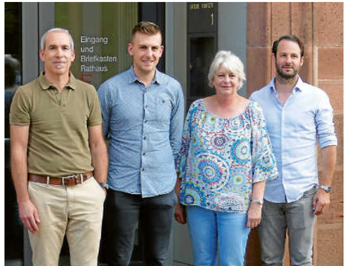
Fraktion SPD & ALB