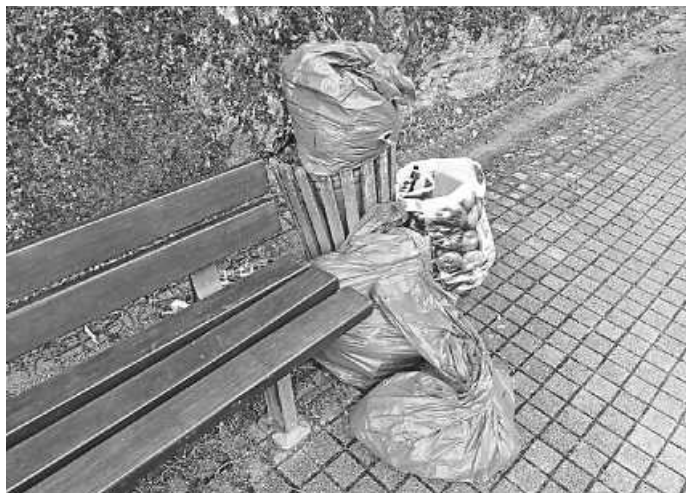
Entsorgung von Hausmüll im öffentlichen Mülleimer am Brunnen beim Sägmühlplatz.

Immer wieder stellen die Mitarbeiter des Gemeindebauhofs fest, dass in öffentlichen Mülleimern u. a. privater Haus- und Restmüll entsorgt wird. So auch in der vergangenen Woche. Eine oder mehrere unbekannte Personen haben im Mülleimer am Brunnen beim Sägmühlplatz eine ordentliche Menge privaten Hausmüll entsorgt. Dabei sollte man wissen, dass die Entsorgung von privatem Müll in öffentlichen Mülleimern als Ordnungswidrigkeit gilt, die mit einem Bußgeld geahndet werden kann. Deshalb weist die Gemeindeverwaltung ausdrücklich darauf hin, dass die öffentlichen Mülleimer ausschließlich für die Entsorgung von Müll dienen, der unterwegs und in kleinen Mengen anfällt. Ein benutztes Taschentuch, das Butterbrotpapier vom Mittagessen oder ein Kaugummi dürfen dort bedenkenlos und ordentlich entsorgt werden. Dafür sind die Mülleimer ja auch da. Die Entsorgung von Hausmüll wie z. B. Restmüll, Altglas, Altpapier oder Elektroschrott hingegen ist verboten! Die Gemeindeverwaltung bittet entsprechend um Beachtung und Einhaltung!