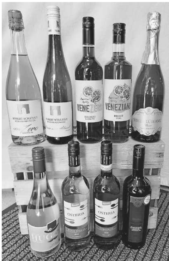
Getränkeauswahl Dorffest 2024