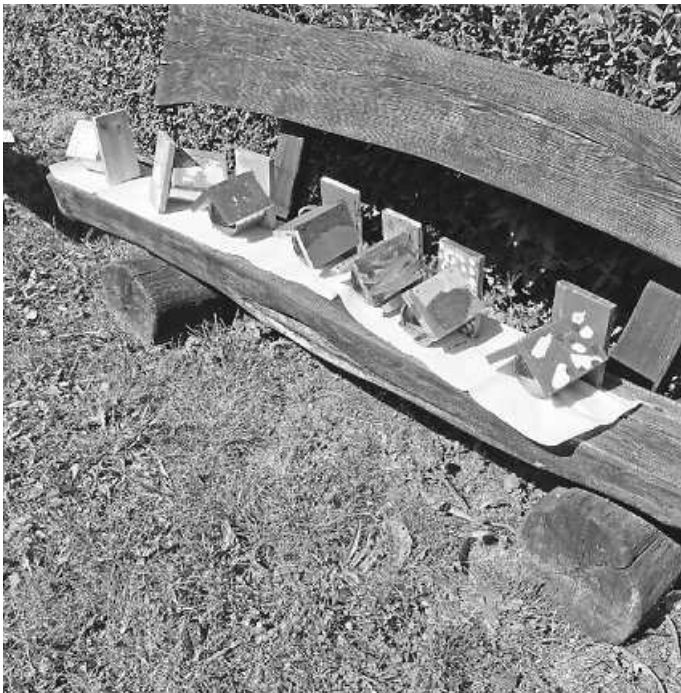
Beim OGV gestaltet