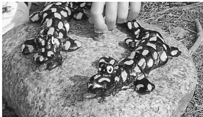
Auf dem Glücksweg in Bernersbach

Wir bedanken uns bei allen, die in irgendeiner Weise diese drei Wochen ermöglicht haben. Nicht nur die Kinder freuen sich schon auf die nächsten Ferien, auch die Erzieherinnen genießen diese Zeit mit den Kindern.