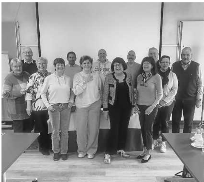
Ehrenamtliche Wohnberater*innen des Kreissenienrates Rastatt e. V.

E-Mail: michaela.hummel@kreissenienrat-rastatt.org