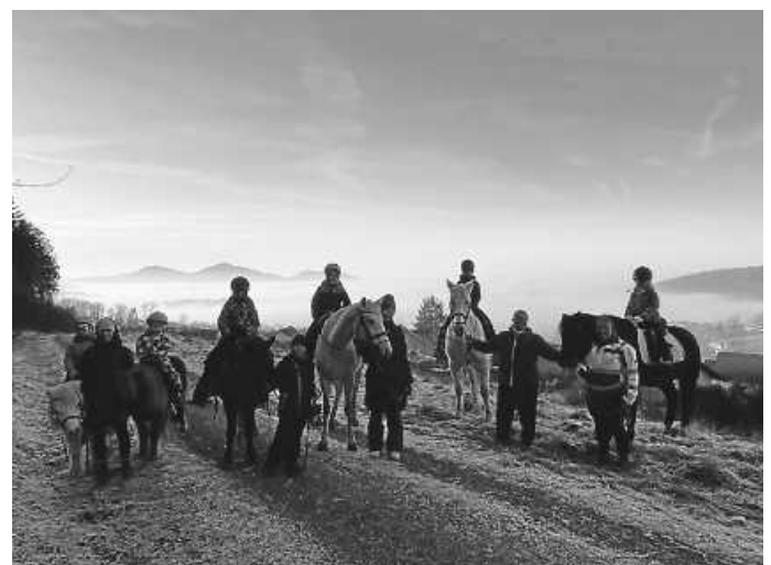
Über den Wolken