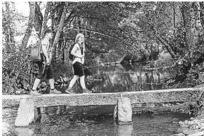
Entdecke deine Heimat neu

Der Heimat entdecken Newsletter präsentiert dir einmal in der Woche die schönsten Seiten von Baden-Württemberg. Werde selbst aktiv zum Heimatentdecker, lese die neuesten Artikel auf LOKALMATADOR.DE, tauche ein in die Nussbaum Erlebniswelt und lerne das Land von ganz neuen Seiten kennen. Als Nussbaum Club-Mitglied sparst du dabei sogar. Jetzt kostenlos anmelden unter https://www.lokalmatador.de/newsletter .