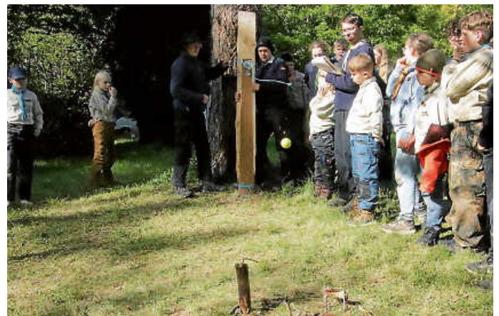
Ob der Ball wohl trifft?

Kreativität, Organisationstalent, Geschicklichkeit – alles Eigenschaften, die die Mädchen und Jungen unserer Pfadfindersippen auf dem Pfingstlager trainiert haben. Die Aufgabenstellung: Eine Wurfmaschine, die allein mit der in ihr gespeicherten Energie in der Lage ist, ein Ziel zu treffen. In kleinen Gruppen machten sich die Pfadfinder ans Werk. Gegenstände aus der Natur durften sie einfach so verwenden. Zusätzlich konnten sie sich Material und Werkzeug erwerben, indem sie verschiedene Aufgaben lösten. Wer sich beispielsweise mit Wiesenblumen gut auskannte, konnte dafür einen Fäustel mitnehmen.